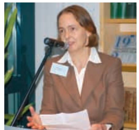
Kammerpräsidentin Irene Schmid bei der Begrüßung am 14.10.09, Foto: Schick

chen Freiheit auf die ökonomische Freiheit entgegen zu treten. Dafür lieferten die Anwesenden ein dankenswertes Beispiel.